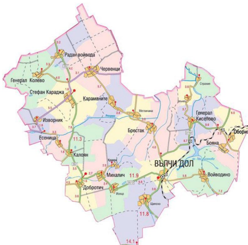
Фигура 1 Карта на община Вълчи дол, източник: Община Вълчи дол

Територията на община Вълчи дол е 472.518 м 2 и заема 12.4% от територията на област Варна и 3.3% от общата площ на Североизточен регион на планиране (СИР).