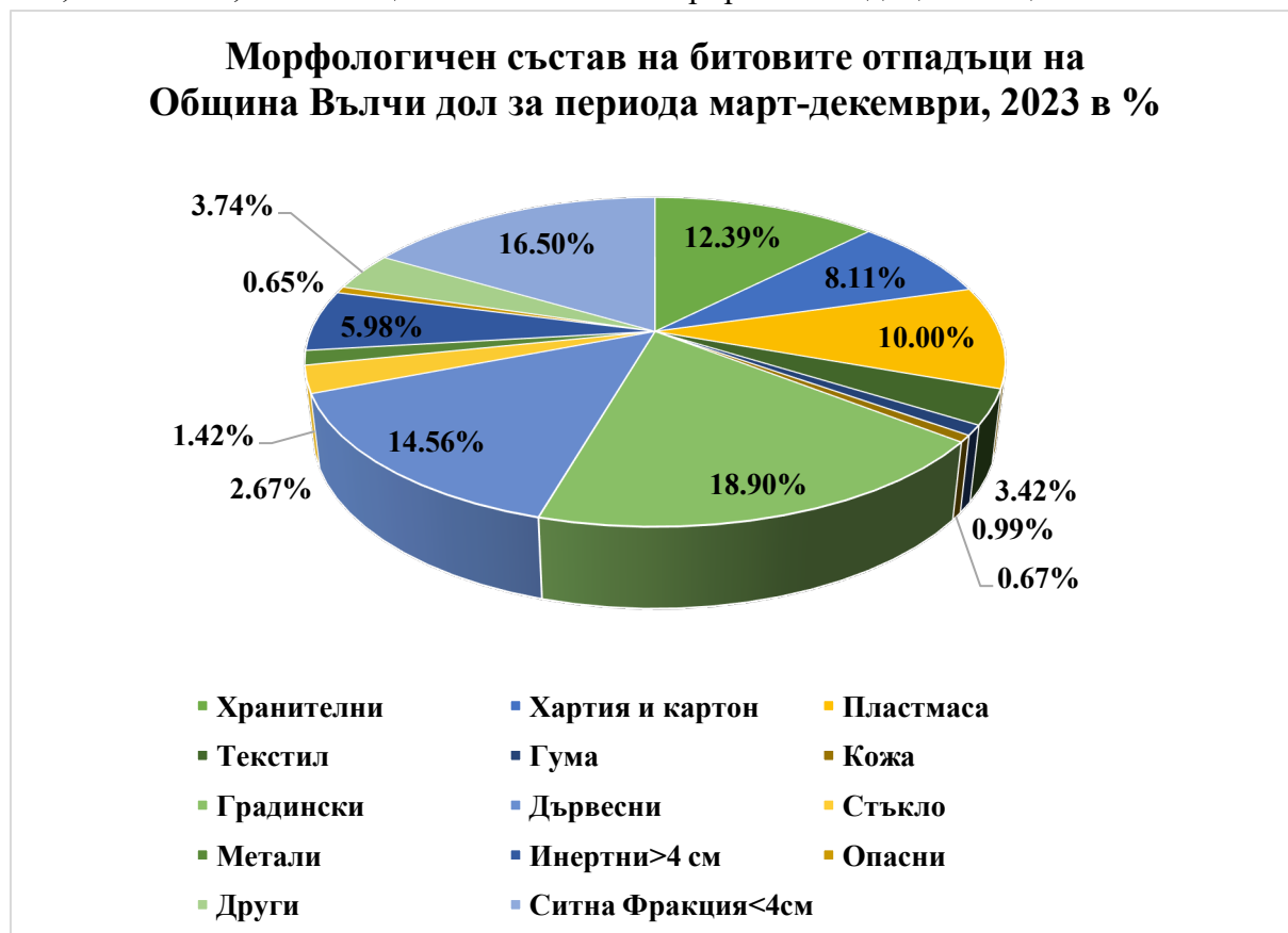
Фигура 2 Морфологичен състав на битовите отпадъци на община Вълчи дол

Делът на рециклираните отпадъци от хартия и картон, пластмаса, стъкло и метали, изчислени на основа на морфологичния анализ проведен през 2023 г. възлиза на 546,96т. или 22,2% от общото количество генерирани отпадъци в общината.